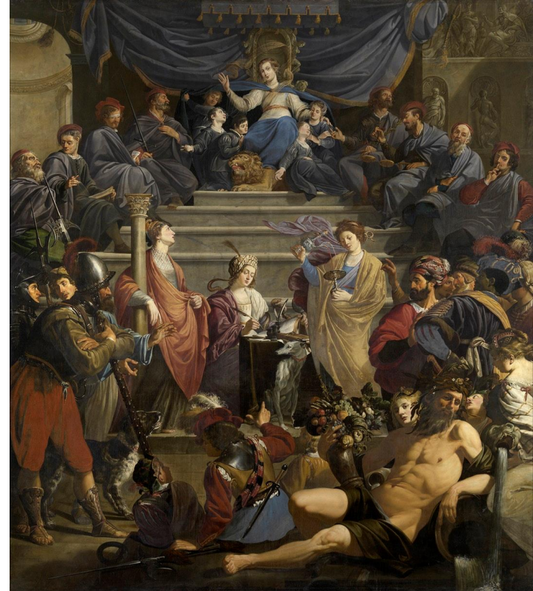
T. Rombouts, Allegorie van het Schepengerecht van Gedele , ca. 1627