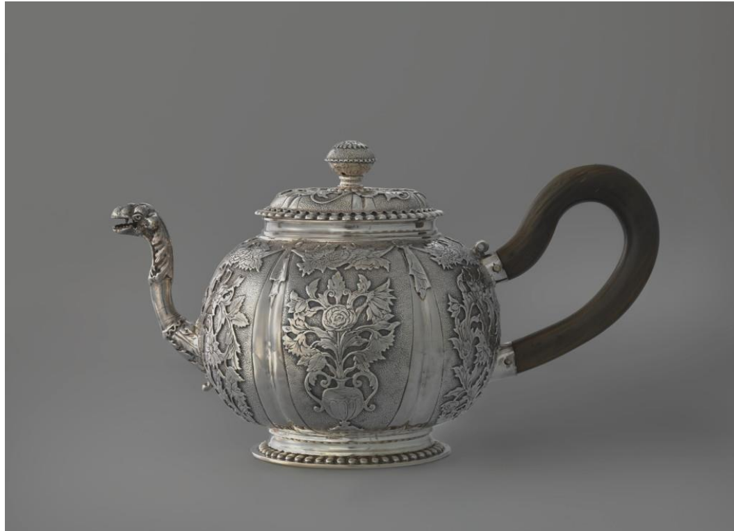
Zilveren theepot, 1696 (Rijksmuseum Amsterdam)

Coperen koelback, 2 kaffecannen, 2 themooren en chokolade pot 2 lb. 10 s. 0 gr.