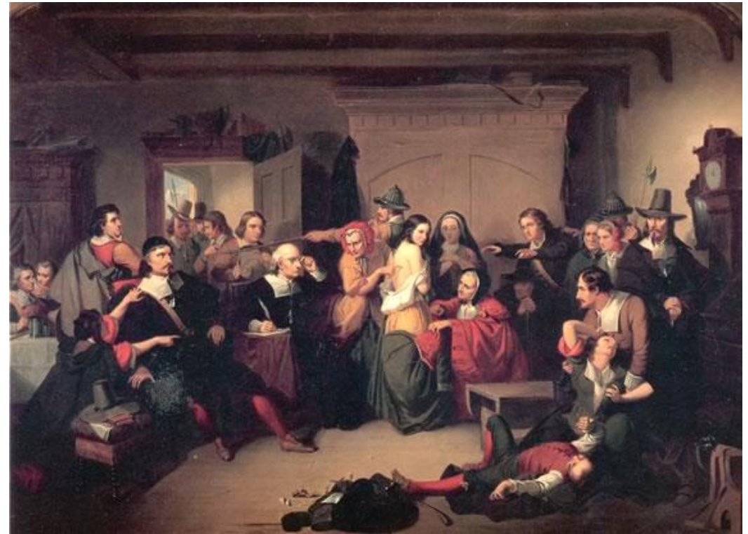
T.H. Matteson, The Examination of a Witch (19 de eeuw)