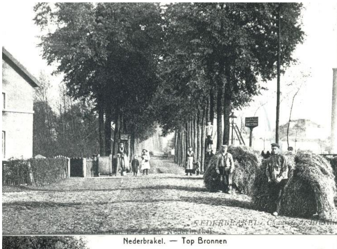
Steenweg naar Brussel